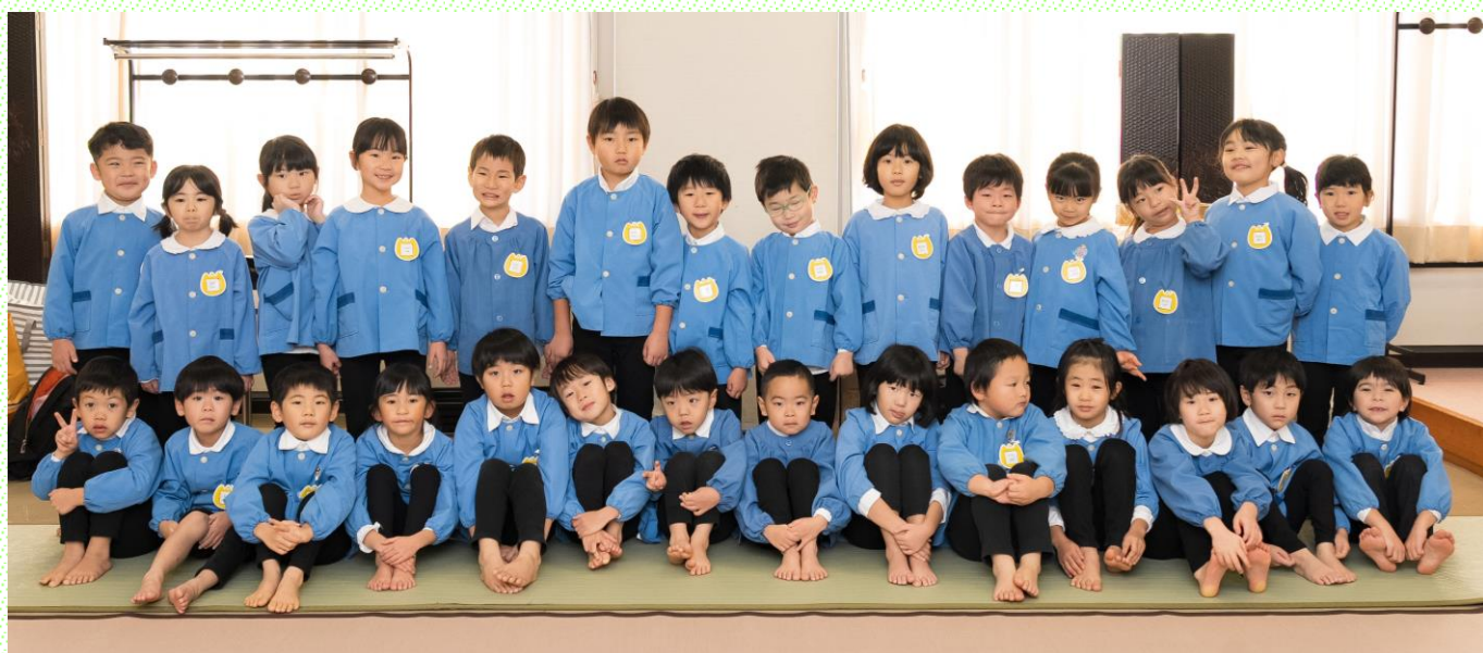
生活発表会の楽屋にて、これからいよいよ本番です。 きいろ組(5歳児)