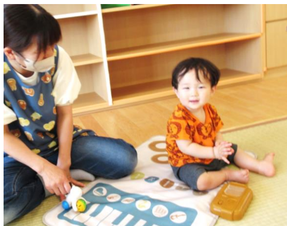
先生と一緒に！にっこり みるく組（0歳児）