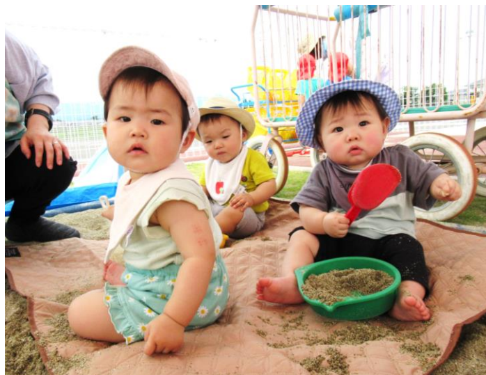
「砂場で遊んだの！スコップ持ったよ」みるく組（0歳児）