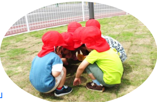
「ほら！むしいたよ」あか組（2歳児）