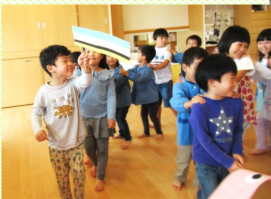
きいろ組(5歳児)こども祭り ジャンケンで勝った友達が先頭になりました。