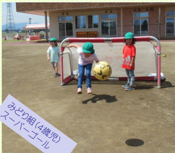
みどり組(4歳児) スーパーゴール