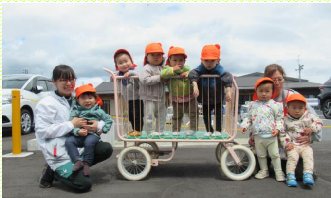
みかん②組(1歳児) こいのぼりと一緒に!