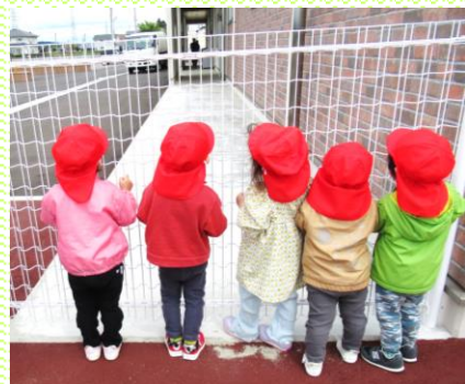
あか組(2歳児)ゴミ収集車だ! 「すごいね」「こっちに来て」