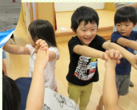
みどり組(4歳児)実習生のお別れ 会アーチを作って送りました