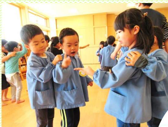
きいろ組(5歳児)こども祭り こいのぼりじゃんけんをしました。