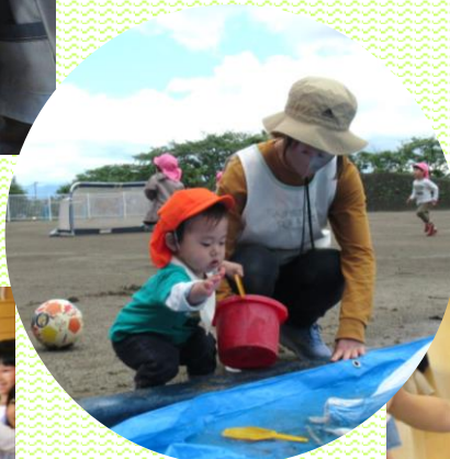
みかん③組(1歳児) 魅力的な水たまり! お水、入れて!