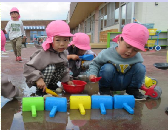
もも組(3歳児) 雨上がりに水たまりが楽しい! 水をすくったり、ローラーでコロコロ